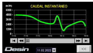
Registro gráfico de la tendencia e histórico del caudal